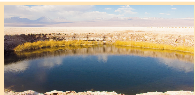
Los Ojos Del Salar tem duas piscinas de água doce (na verdade muitíssimo pouco salgada) no meio do Deserto de Sal

nha sobre as águas, lá na frente, sempre imponente, quem o observa do alto dos seus 5.000 metros é o Licancabur, o vulcão mais lindo de todos.