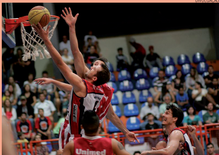
O jogo emocionante da classificação foi realizado no último dia 4 de outubro

Aos sons da torcida "o Campeão Voltou" a Winner/Limeira carimbou seu passaporte para a Final do Campeonato Paulista 2014. Um jogo emocionante, realizado no último dia 4 de outubro, com muita festa nas arquibancadas do Ginásio Vô Lucato.