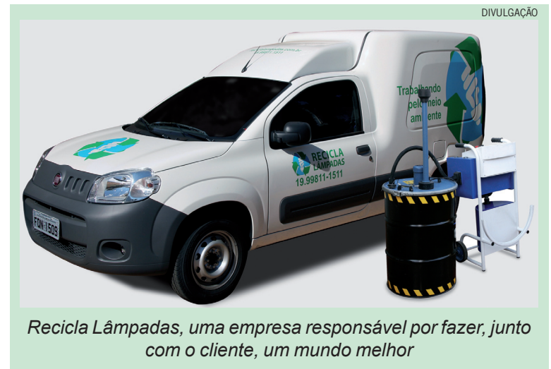
Recicla Lâmpadas, uma empresa responsável por fazer, junto com o cliente, um mundo melhor

“Uma nova LUZ nos remete sempre a novas ideias. Caso ela queime, nos ligue