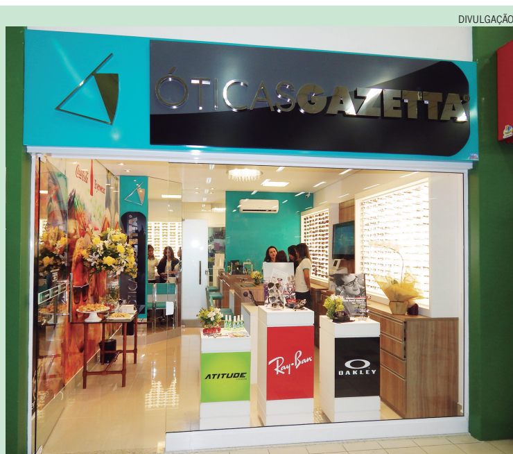
A nova Óticas Gazetta do supermercado Enxuto funciona de segunda a sexta-feira, das 9h às 21h e aos sábados das 9h às 17h

ta-feira das 8h30 às 18h e aos sábados das 8h30 às 14h. A filial localizada no hipermercado Covabra, fica na Av. Campinas, 50 e atende também pelo telefone (19) 3443-3894. O horário de funcionamento é de segunda a sexta-feira das 9h às 21h e aos sábados das 9h às 17h. A mais recente unidade se encontra no supermercado Enxuto e funciona também de segunda a sexta-feira das 9h às 21h e aos sábados das 9h às 17h. Entre em contato pelo telefone (19) 3443-8896. “Venha conferir a qualidade que a Óticas Gazetta oferece à todos os clientes”, convidam as sócias.