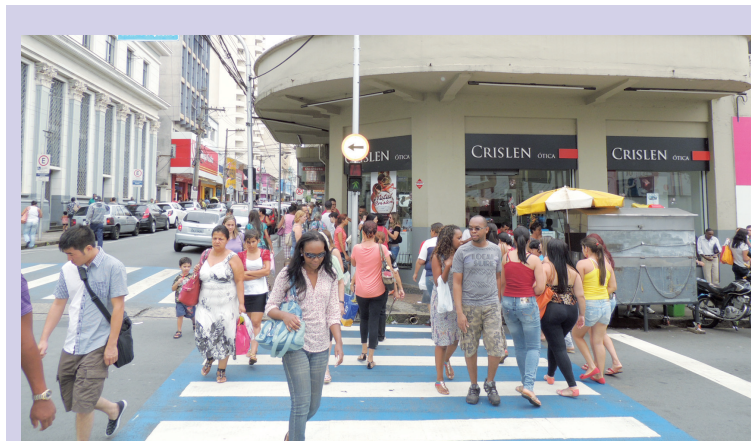
O comércio deve começar a se preparar para maior data de vendas, o Natal